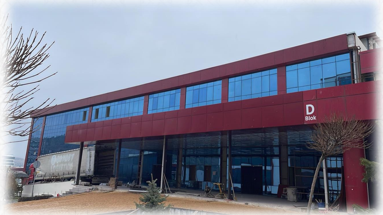
Çocuk Acil Hizmet Binası görseli

Çocuk Acil Hizmet Binası projemizin geçici kabulü yapılmıştır. FTR Hastanesi ve Muhtelif İşler 2025 yılında devam eden projelerimiz içerisinde yer almaktadır.