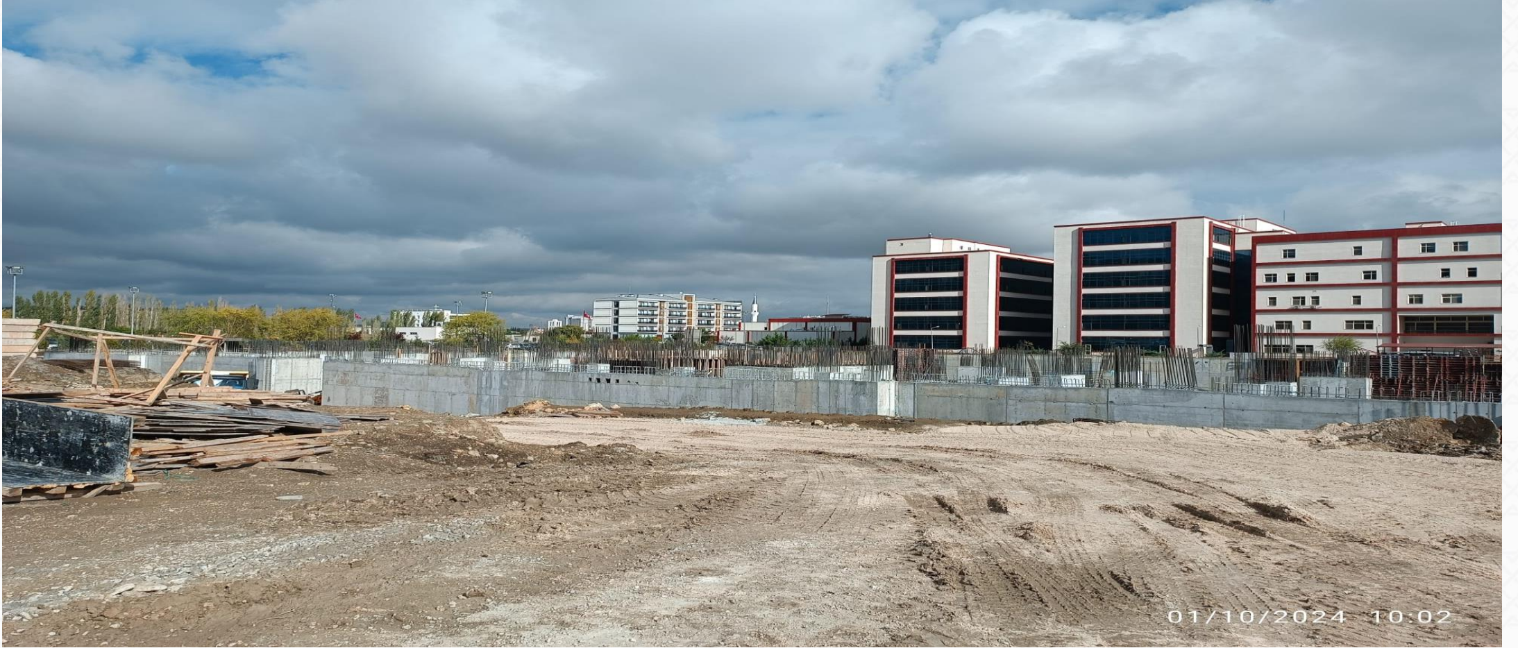
FTR Hastanesi Temeli