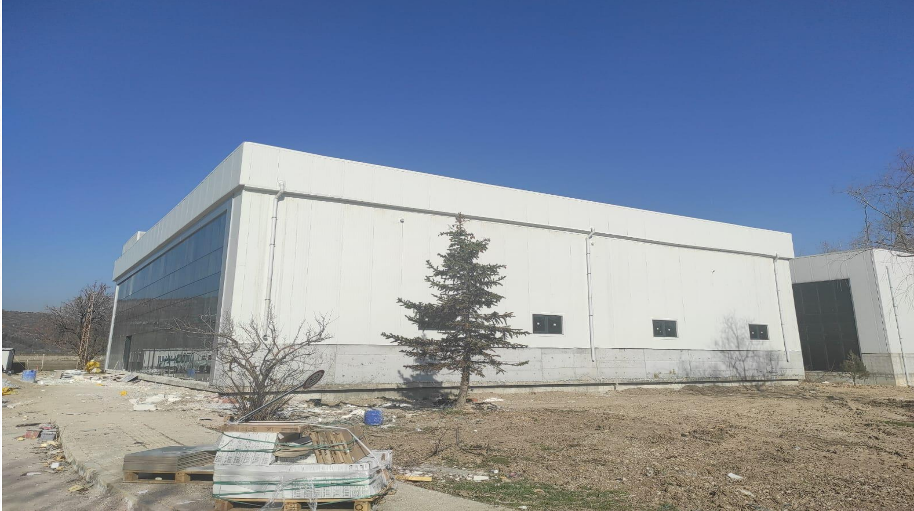
Merkezi Araştırma Laboratuvarı