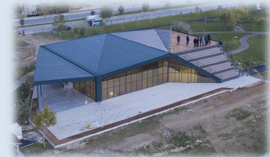
KANO MERKEZİ 2021

2024 YILI İÇERİSİNDE 6.672.019,90.-TL SÖZLEŞME BEDELİNE SAHİP TOPLAM 12 ADET İŞİN KONTROLLÜK HİZMETLERİ MÜDÜRLÜĞÜMÜZ TEKNİK PERSONELİ TARAFINDAN GERÇEKLEŞTİRİLMEKTEDİR.