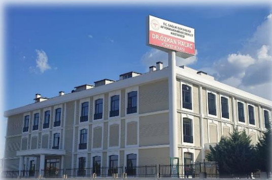
DEVLET HASTANESİ EK BİNASI 2022