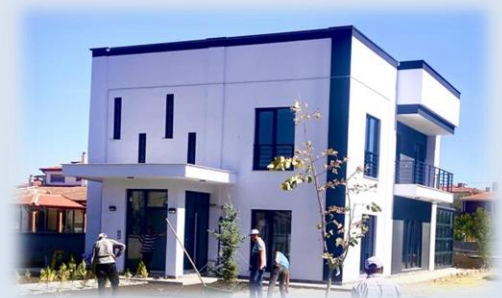
ÇAY KAYMAKAMI LOJMANI 2023